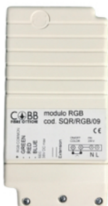
MODULO CONTROLLO COLORE