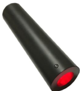
ILLUMINATORE RGB 9W