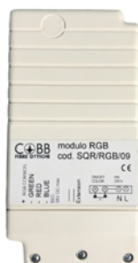
MODULO CONTROLLO COLORE