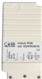
MODULO CONTROLLO COLORE