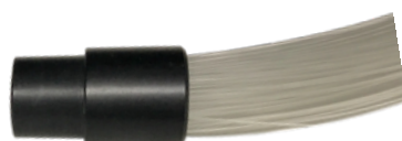
CONNETTORE COMUNE FASCIO A FIBRE OTTICHE