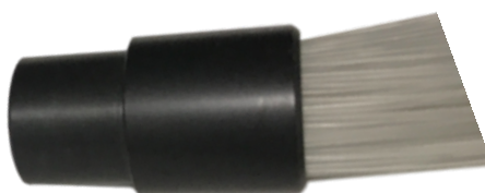
CONNETTORE COMUNE FASCIO A FIBRE OTTICHE