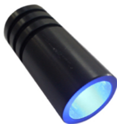
ILLUMINATORE RGB 3W