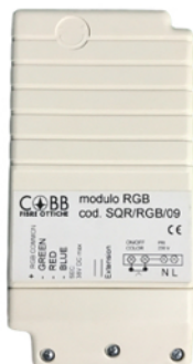
MODULO CONTROLLO COLORE