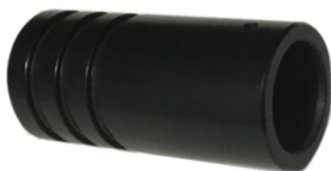
ILLUMINATORE LED 3W